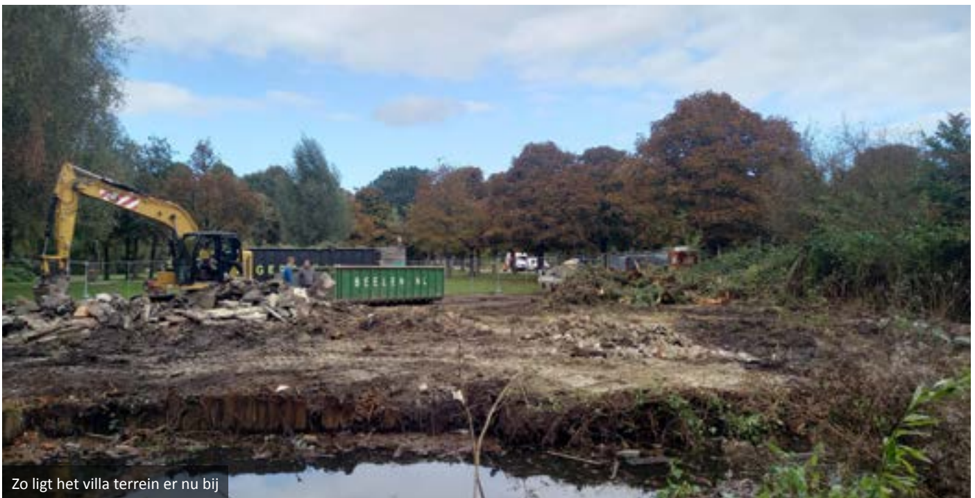
Zo ligt het villa terrein er nu bij

Link naar DWARS: https://dwars-door-amsterdam-oost.nl/de-verbor-gen-villa-in-park-frankendael/