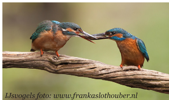
Ijsvogels