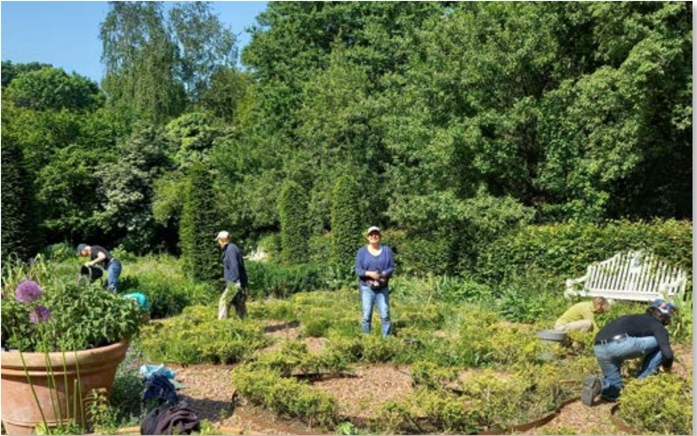
Actie 'opschonen stijltuin'